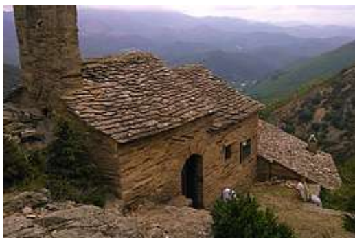
Chapelle Saint-Eutrope Castanet-le-Haut (Hérault)