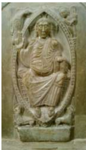
Christ - Basilique St Cernin de Toulouse

Vous obtiendrez les réponses à vos questions, le réconfort et l'énergie pour poursuivre le chemin. Le silence, la bienveillance permettent la communion et chaque fois un cadeau vous attendra.