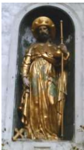
Saint Jacques Apôtre Cathédrale St Etienne de Toulouse

Faites l'expérience de cette Union : l'Être aimé, honoré, sanctifié n'est plus à l'extérieur de nous sous forme de sculpture, de peinture ou de vitrail, Il est Nous, dans toute la beauté de notre Être. Nous pouvons alors incarner sa paix, sa joie, son amour et sa lumière, en toute humilité.