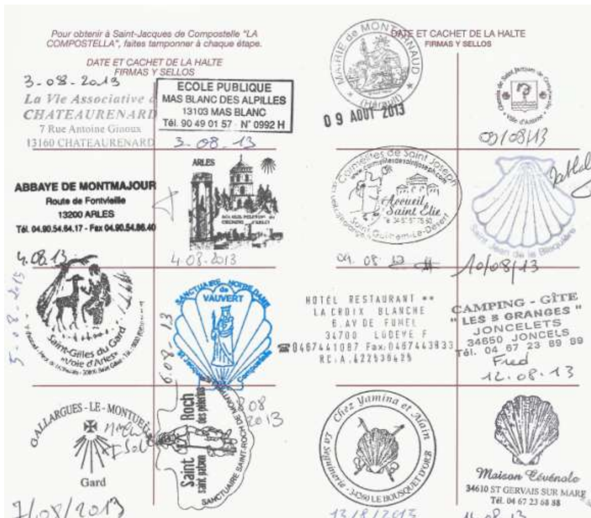
Mon credencial ou carnet de pèlerin – saison I